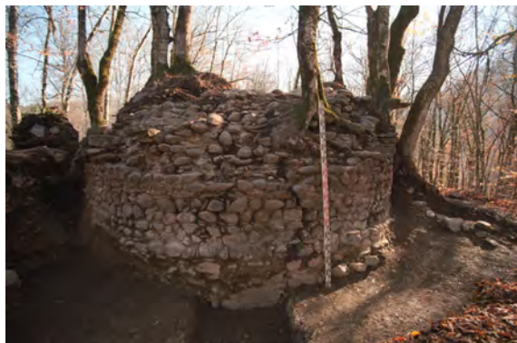
Западный фас полукруглой башни. Вид с запада.

В 2007–2008 гг. исследования крепости продолжились – отрядом под руководством В.В. Верещагина в 2007 г. была уточнена топография городища, заложены шурфы с целью определения мощности культурного