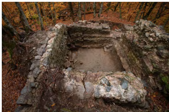
План северного помещения двухчастной прямоугольной башни. Вид с запада, сверху.

На период с 2007 по 2010 гг. для исследования, проектирования, реставрации методом консервации на территории Ачипсинской крепости определены следующие объекты: центральная башня, вклю-