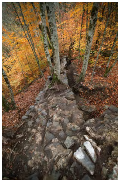
План стены, примыкающей к северо-восточному углу двухчастой прямоугольной башни. Вид с юга, сверху.

– установление охранной зоны с учетом исторической ценности прилегающего пространства (охранная зона должна включать не только архитектурные сооружения крепости и ров, расположенный к северо-западу от стен).