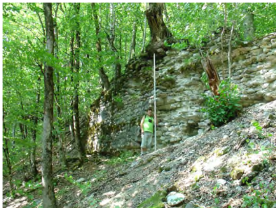
Наиболее сохранившаяся часть южной стены. Южный фас. Вид с юго-востока.

ал, полностью соответствующий исходному, чтобы не изменялся характер взаимодействий в природно-археологической системе. При реконструкции должна быть четко обозначена граница исторического объекта и новодела;