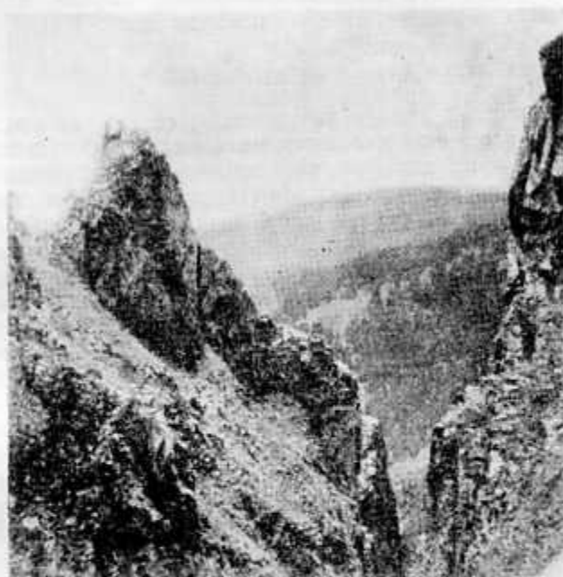
Рис. 3. Хребет Ахнарха. Места летнего пребывания серн и туров.

В западноевропейской литературе по альпийской серне имеются указания, что серны часто заражаются болезнями, заносимыми в горы домашним скотом (вертячка, ящур, сибирская язва, железница и др.). Такие же указания, к сожалению, более сбивчивые и неопределенные, имеются в отношении Западного Кавказа. Так, Н. Динник (5) пишет: „Охотники горных станиц неоднократно говорили мне, да я и сам наблюдал раза два, что в те годы, когда ящуром болеет домашний скот в горной полосе,