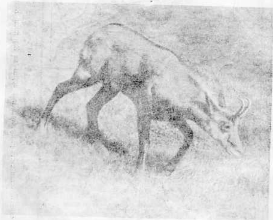
Рис. 2. Кавказская серна.

Если сравнить район суточных кочевок туров и серн, то мы должны будем признать, что у серн он значительно уже и часто ограничен в пределах 4—5 км, считая по прямой. Животные с большим постоянством придерживаются своих участков, появляясь с исключительной правильностью в определенные часы суток на различных склонах. Еще более узки районы суточных передвижек серн в лесной зоне гор, где большинство животных привязано к скалистым „щиграм“ и немногим кормовым дужай-